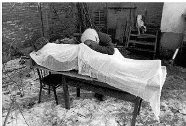
Гудермес, декабрь 1995 г. После окончания боев.

К 13 декабря подошедшие части федеральных войск, в свою очередь, полностью окружили город. 14 декабря начались интенсивные перестрелки между боевиками и федеральными войсками, как находящимися в городе, так и взявшими его в кольцо. Вплоть до 19 декабря шли интенсивные бои, повлекшие большое число жертв среди мирного населения. По рассказам жителей города, бойцы вооруженных формирований ЧРИ располагали свои военные объекты среди гражданских, нередко вели стрельбу из жилых домов, где находились мирные жители.