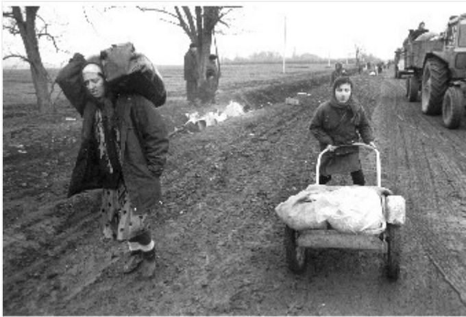
4 марта 1996 г. Исход жителей из Серноводска.

В течение двух следующих дней отдельные районы Серноводска подвергались ударам, в том числе из установок «Град». 5 марта был возобновлен массированный обстрел села с земли и воздуха. Доступ в село и выезд из него были полностью прекращены (лишь за плату или водку солдаты выпускали из села пожилых русских людей). Из села удалось выбраться только несколькими десятками человек.