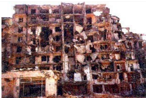
Грозный, 1995 г.

Должностные лица МО РФ неоднократно заявляли, что для предотвращения гибели мирного населения применяется современное высокоточное оружие, и только для нанесения ударов по военным объектам. Однако такое оружие если и применялось, то явно не в тех масштабах, чтобы заметно повысить точность поражения и исключить неизбирательный огонь и неприцельное бомбометание. Более того, лишь после заявления президента России 27 декабря 1994 г. о прекращении бомбардировок Грозного представители МО сообщили СМИ, что впредь федеральная армия намерена использовать «высокоточное оружие с лазерным наведением для уничтожения военных объектов дудаевского режима». Командующий федеральными ВВС П.С. Дейнекин сообщил в интервью корреспонденту газеты «Московский комсомолец» 21 марта 1995 г., что до 29 декабря 1994 г. использование оружия с лазерным или телевизионным наведением в районе Грозного было невозможно из-за неблагоприятных погодных условий. Таким образом, применение свободнопадающих бомб и неуправляемых авиационных ракет для бомбардировки территории густонаселенного города в условиях, когда, по словам командующего, «землю вообще не видно» и бомбометание ведется с высоты 5–7 тыс. м, не может рассматриваться иначе как вполне осознанное неприцельное бомбометание, с неизбежностью влекущее большие жертвы среди мирного населения.