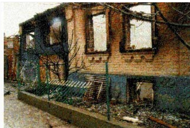
Самашки. Дом по ул.Выгонной.

Лишь часть многочисленных разрушений жилых и общественных зданий — результат обстрелов села и происшедших там вооруженных столкновений. Большинство домов было разрушено в результате преднамеренных поджогов, совершенных военнослужащими ВВ и сотрудниками МВД РФ. По свидетельствам жителей Самашек, оставшихся в селе 7–8 апреля, множество домов было подожжено 8 апреля во время «зачистки» села. Характер разрушений подтверждает показания жителей: очень часто в разрушенных и сожженных дворах целы ворота и заборы, выходящие на улицу; на них и на стоящих стенах нет следов ни от пуль, ни от осколков гранат, мин или снарядов. Представители НМПО лично видели, что наибольшее число пожаров в селе началось именно в первой половине дня 8 апреля, когда в селе производилась «зачистка».