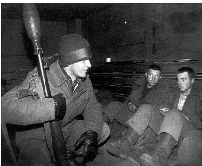
Грозный, площадь «Минутка», подвал кафе «999». 12 января 1995 г. Пленные российские военнослужащие из 503-го мотострелкового полка.

В декабре — начале января 1995 г. чеченской стороной было взято в плен до 200 российских военнослужащих.