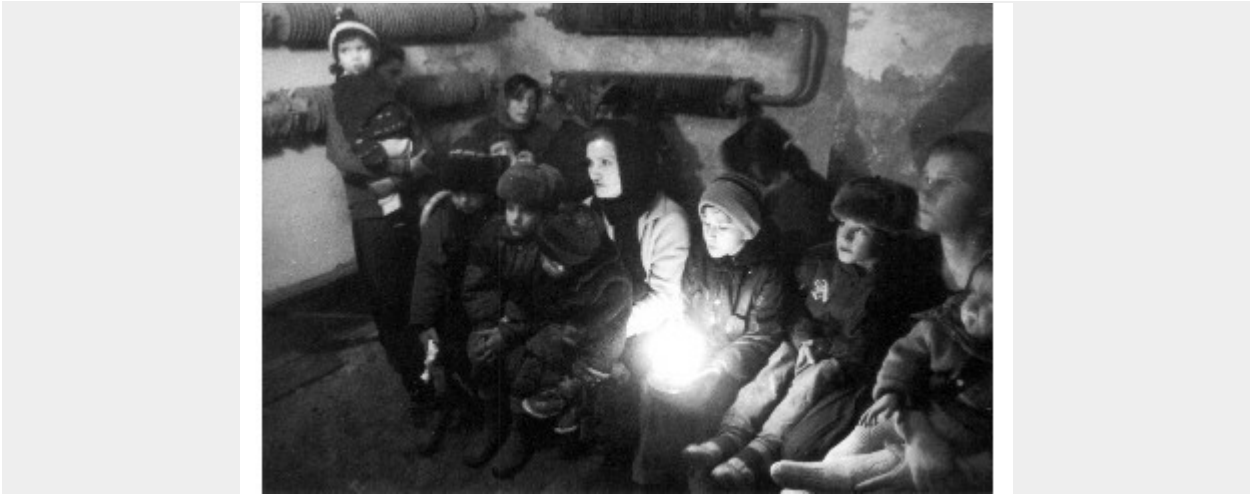
Грозный зима 1994-1995 гг. В подвале жилого дома.

Военнослужащие федеральных сил располагали свои позиции в жилых домах и вели огонь по таким же позициям чеченских отрядов. Обе стороны при этом не брали в расчет безопасность мирных жителей, в большом числе прятавшихся в подвалах этих же домов 1 .