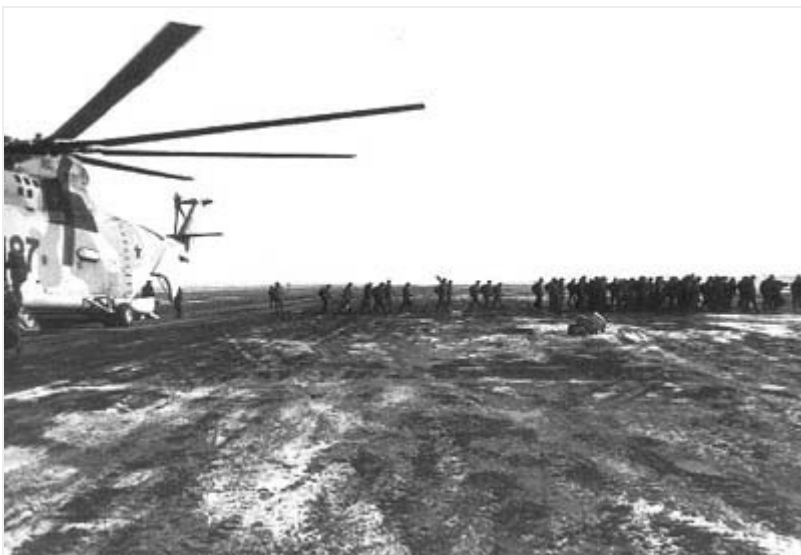
Ханкала, база федеральных сил в Чечне. Прибыло пополнение.

20 апреля в Грозном состоялось собрание поддерживающих правительство Д.Завгаева «представителей 22 районов республики, старейшин, бизнесменов и политиков, всего приблизительно 350–400 человек». По словам Д.Завгаева, к этому дню соглашение о соблюдении мира не было подписано лишь в 15 населенных пунктах. Шла также подготовка Договора об общественном согласии, который должен был стать «реальным инструментом мирных переговоров».