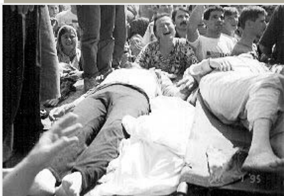
Грозный. Убийство 7 июля 1995г. семьи Чапаровых вызвало массовые митинги протеста.

5 июля указом Б.Н.Ельцина А.С.Куликов назначен министром внутренних дел, а В.А.Михайлов — министром по делам национальностей и региональной политике.