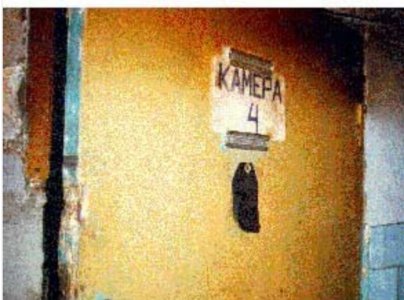
Внутренние помещения грозненского фильтрационного пункта. сделанные осенью 1996 г. после закрытия ФП

По имеющимся у ПЦ «Мемориал» сведениям, в мае 1995 г. после убийства в этом ФП трех сотрудников промосковского МВД ЧР (см. раздел 3.5 ) последовала проверка его работы комиссией МВД РФ. Так же как и в Моздоке, кто-то из начальства был наказан в дисциплинарном порядке, однако к уголовной ответственности никто привлечен не был. Так же как и в Моздоке, условия содержания и обращение с задержанными несколько улучшились.