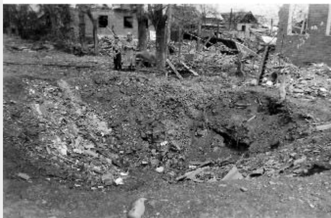
Самашки, март 1996 г